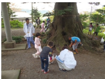
どんぐり拾い状況(H23.10～11)