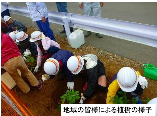
地域の皆様による植樹の様子