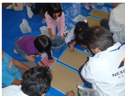
どんぐり拾い(播種※作業)(H23.10～11)