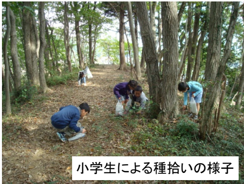
小学生による種拾いの様子