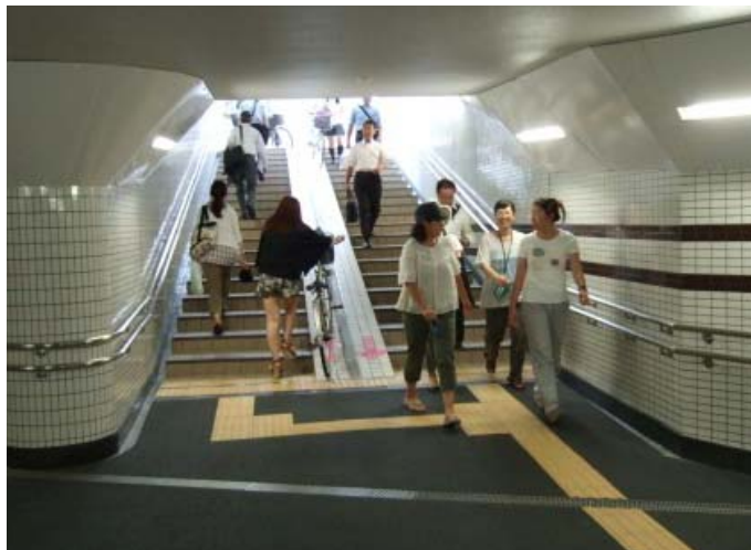
■横断地下道の利用状況