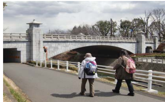
「甲州夢街道ウォーク」の実施状況