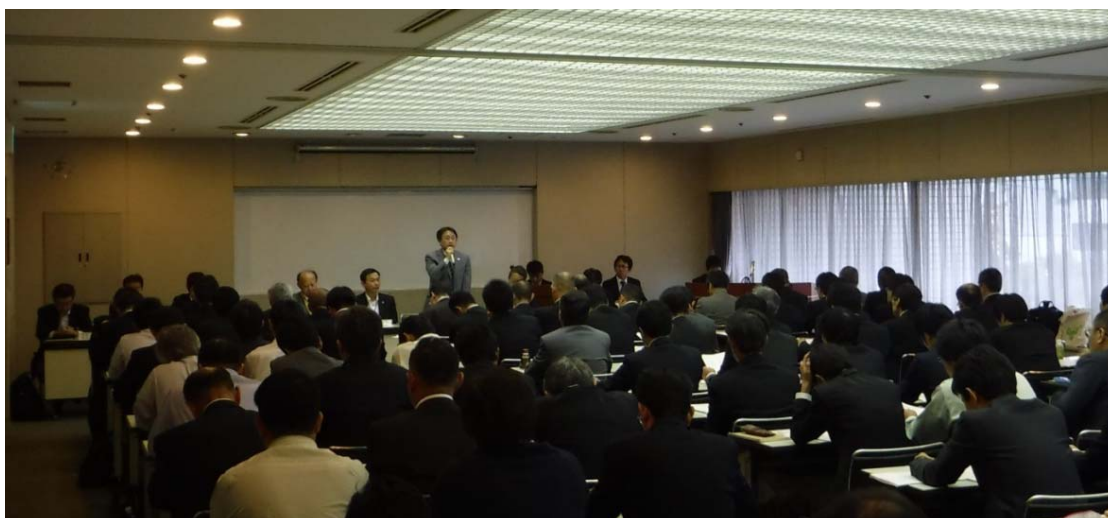
平成28年度第2回道路メンテナンス会議の実施状況（H28.10.25）