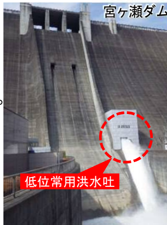
低位常用洪水吐からの放流 [平成29年2月22日放流点検]