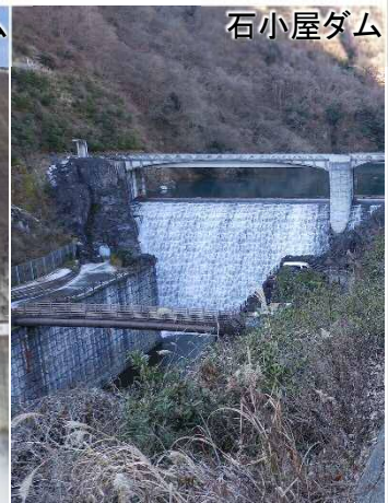
堤頂部からの放流 [平成26年1月23日]