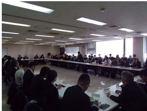
H27.12.24 (道路メンテナンス会議の実施状況)