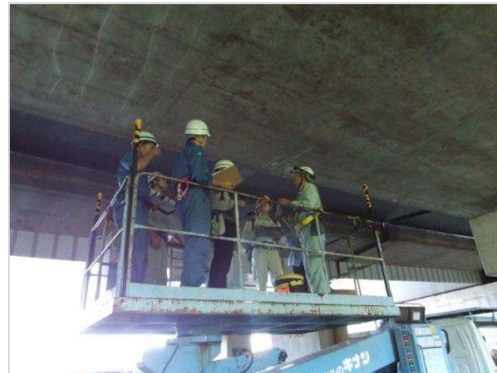
H26.10.19 (神奈川県橋梁点検講習会)