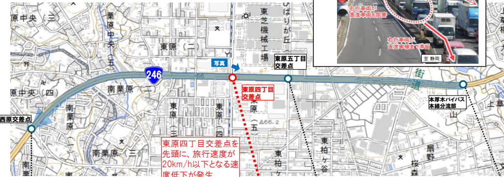
■ 東原四丁目交差点周辺の旅行速度 (国道246号 下り)