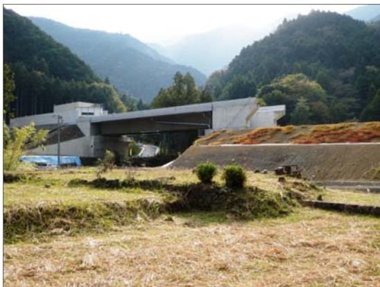
④ しおざわ 塩沢川橋