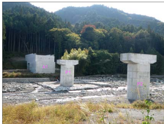
⑤ とくり 戸栗川橋