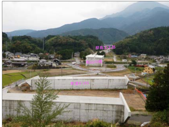
⑦ やなぎしま 柳島地区