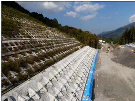
⑥ やなぎしま 柳島地区