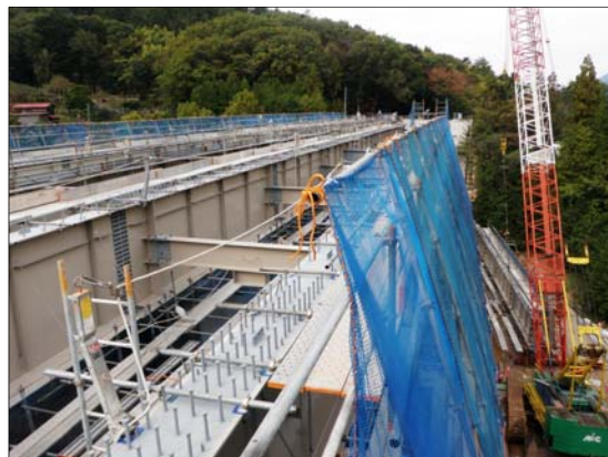
⑨ やざわ 矢沢川橋