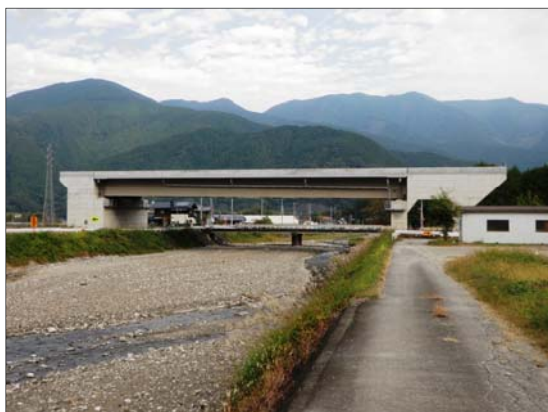
⑧ ふなやま 船山川橋