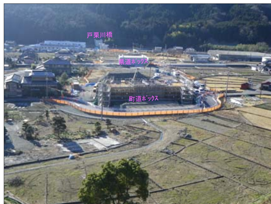
やなぎしま 柳島地区