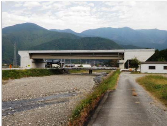
ふなやま 船山川橋