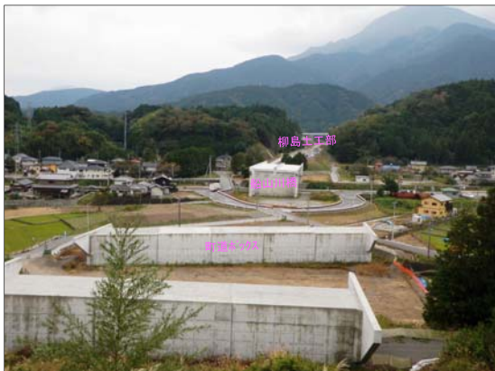
やなぎしま 柳島地区