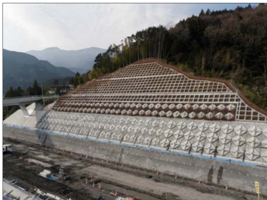
やなぎしま 柳島地区