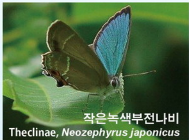
작은녹색부전나비 Theclinae, Neozephyrus japonicus