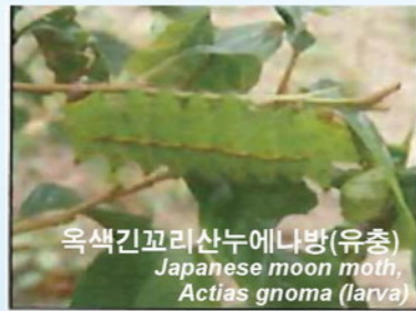
옥색긴꼬리산누에나방(유충) Japanese moon moth, Actias gnoma (larva)