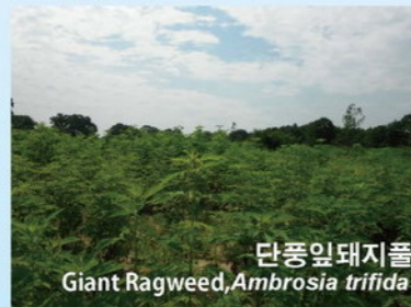
단풍잎돼지풀 Giant Ragweed, Ambrosia trifida