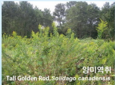
양미역취 Tall Golden Rod, Solidago canadensis