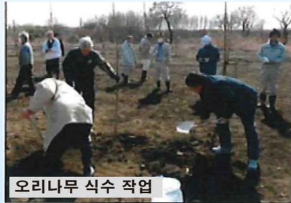
오리나무 식수 작업