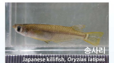
송사리 Japanese killifish, Oryzias latipes