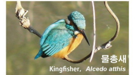
물총새 Kingfisher, Alcedo atthis

주변의 상세 정보가 표시됩니다. More information on the surroundings will be displayed.