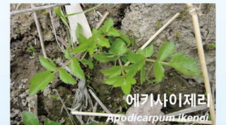
에키사이제리 Equisetum japonicum