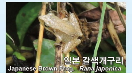
일본 갈색개구리 Japanese Brown Frog, Rana japonica

아라카와강 다로에몬지구 자연재생협의회 사무국 350-1124 사이타마현 가와고에시 신주쿠초 3-12 TEL: 049-220-0145(직통)