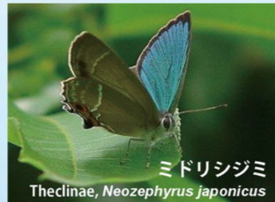
ミドリシジミ Theclinae, Neozephyrus japonicus