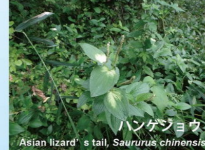
ハンゲショウ Asian lizard's tail, Saururus chinensis