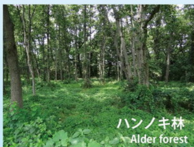
ハンノキ林 Alder forest