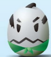
荒川太郎右衛門地区自然再生事業 イメージキャラクター 「たろえもん」