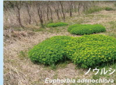
ノウルシ Euphorbia adenochlora