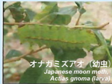
オナガミズアオ (幼虫) Japanese moon moth, Actias gnoma (larva)