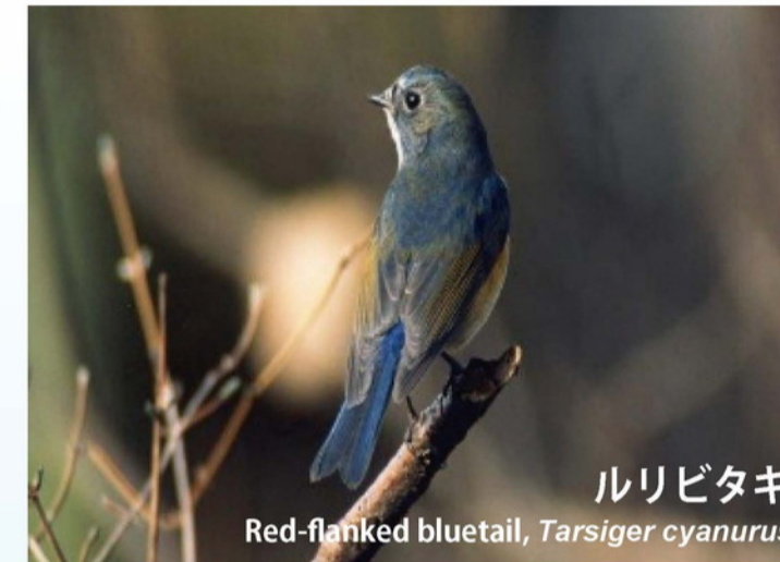
ルリビタキ Red-flanked blue-tail, Tarsiger cyanurus