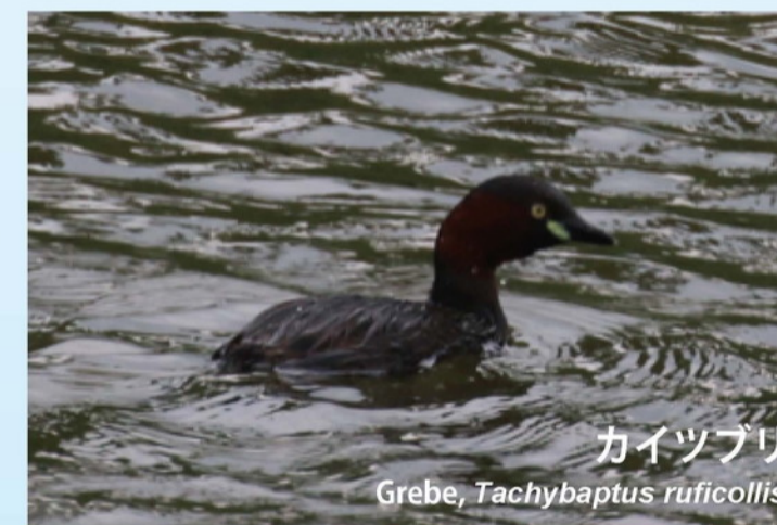
カイツブリ Grebe, Tachybaptus ruficollis