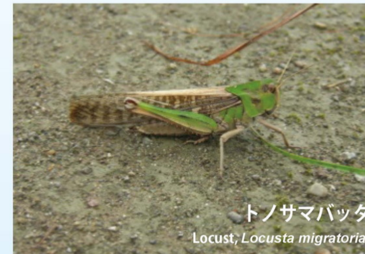
トノサマバッタ Locust, Locusta migratoria