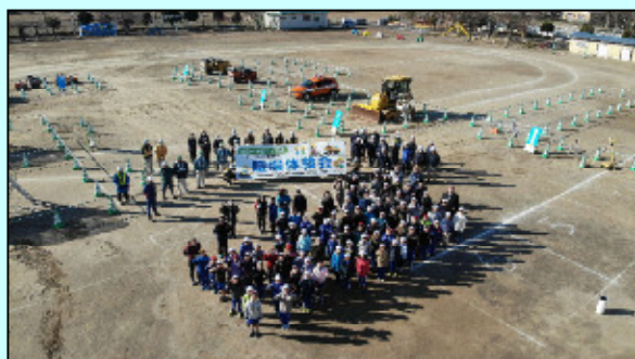
ドローンで記念撮影