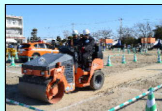
ロードローラ乗車体験