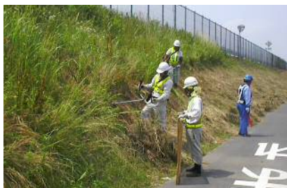
〈機械除草状況（法面）〉

実施時期については、気象条件や道路巡回により繁茂状況を確認した上で適切な時期を設定して6月～12月頃に交通に支障となる箇所を限定して実施します。