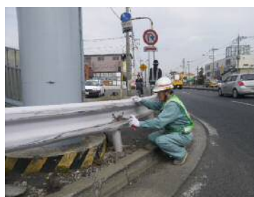
〈構造物の状況確認（防護柵損傷）〉