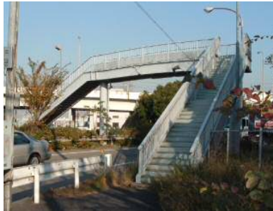
〈大塚新田（南）歩道橋〉 (国道 1 6 号川越市大塚新田地先)