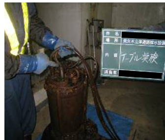
〈排水設備 定期点検状況〉