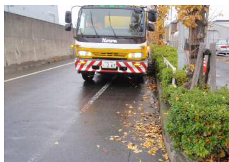
〈路面清掃状況 (機械)〉