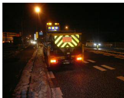
〈凍結防止剤散布状況〉