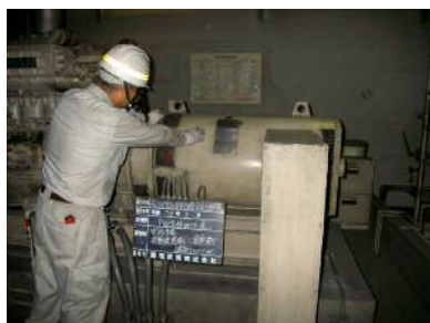
〈発電設備 定期点検状況〉

道路管理を行う上で重要な道路管理施設（道路情報表示設備、道路排水設備（ポンプ）等）について、点検により健全度を把握するとともに、適切に作動するように管理します。