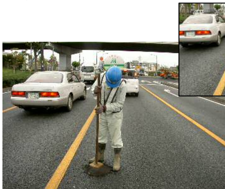
〈路面補修状況（ポットホール補修）〉

路面異状（ポットホール、段差など）処理（補修）、落下物回収及び交通事故などの路面油処理などを迅速かつ適切に行います。