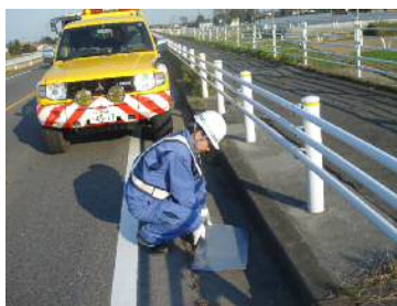
〈落下物の回収状況〉