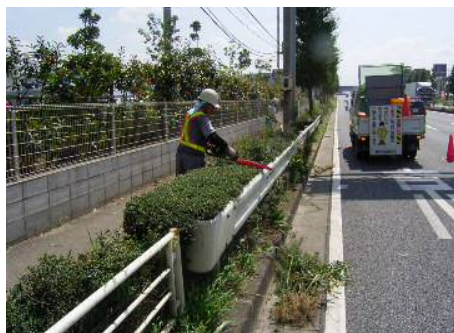
〈低木寄植剪定状況〉