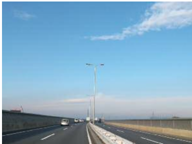
〈照明灯〉 (国道 1 7 号 熊谷市肥塚地先)