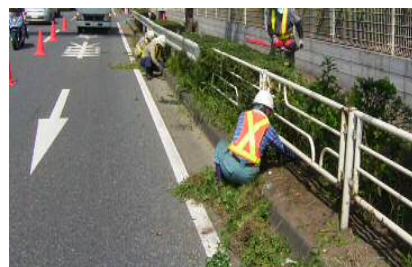
〈抜根除草状況（植樹帯）〉