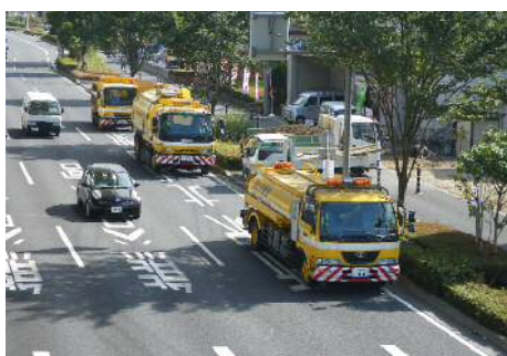
〈路面清掃状況 全景〉

※清掃回数については上記表を目安としますが、路面状況により増減の可能性があります。