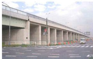
〈柿沼肥塚立体ラーメンボックス〉