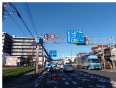
〈標識〉 (国道 1 6 号川越市新宿地先)