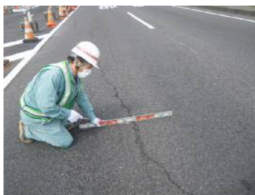
〈路面状況確認（わだち発生）〉

・異常時巡回は、台風などの異常気象及び地震発生時等に、道路施設の被災状況、通行可否等の確認のため適宜実施します。