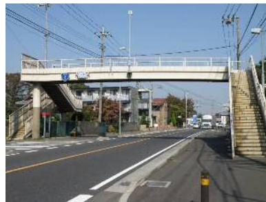
〈小湊歩道橋〉 (国道 4 号：春日部市小湊地先)