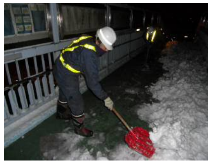
〈歩道橋除雪作業状況〉

④大雪時もしくは大雪が予想される場合には、道路の状況を確認の上、早期の除雪に出動すること等により適時適切な除雪作業を実施します。