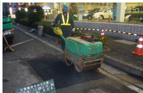
〈路面補修状況（パッチング）〉