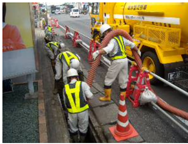
〈側溝清掃状況（機械）〉

排水系統を確保し、流下能力を維持するために、排水施設に堆積している土砂を除去します。実施箇所については、排水系統や流下能力を勘案して通水障害箇所を抽出し、通常巡回等により土砂の堆積状況などを確認した上で年1回程度実施します。