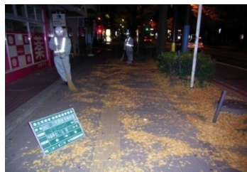
夜間時の清掃作業