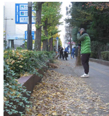
昨年度の実施状況