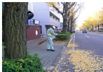
昼間時の清掃作業