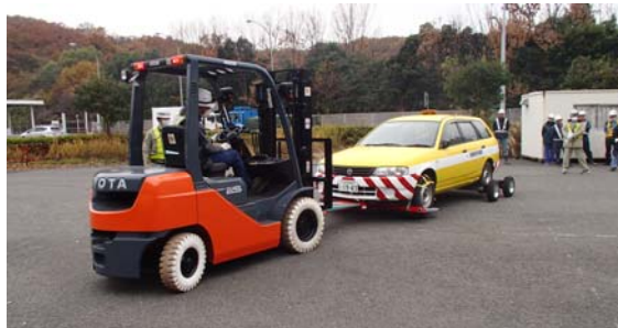
フォークリフトを使用した車両移動訓練状況