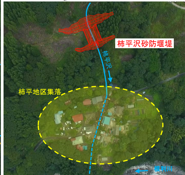
柿平沢砂防堰堤施工箇所状況