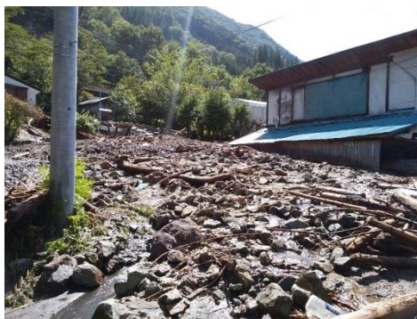
土石流の状況 (H28. 9. 7)