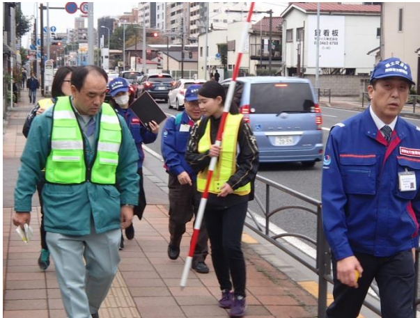
徒歩パト(市場入口交差点～ 生麦一丁目交差点・上り線)その1