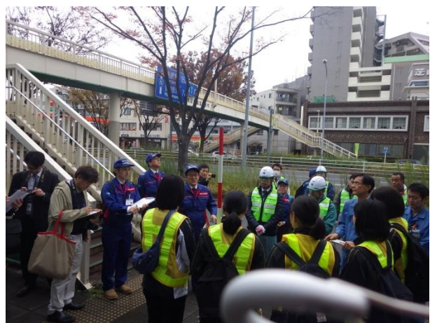
鶴見中継所周辺点検. 作業結果の 報告