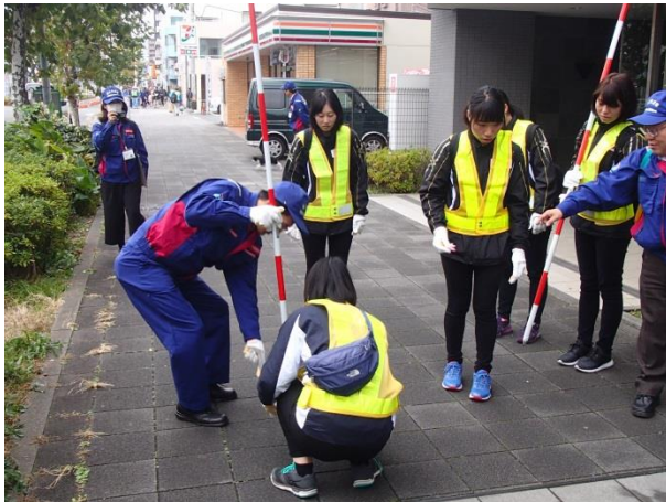
鶴見中継所周辺点検(国道15号 歩道平板のがたつきチェック)