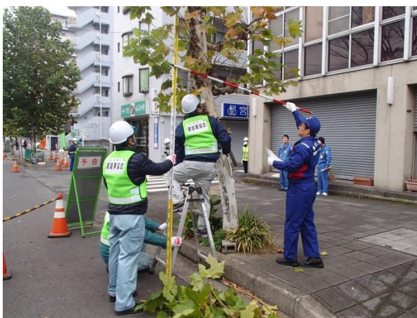
鶴見中継所周辺の国道15号街路 樹の高さ不足の枝を伐採