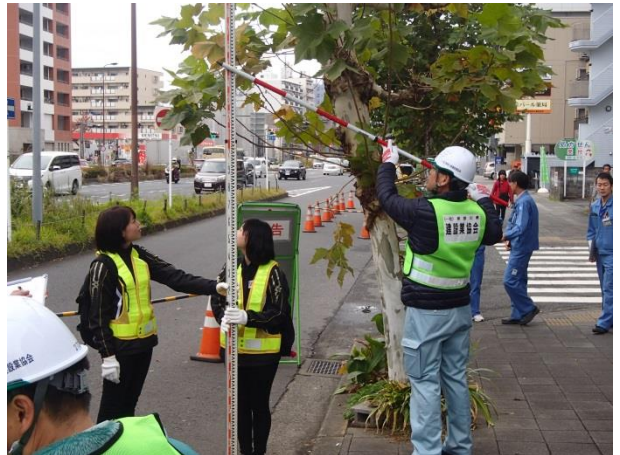
鶴見中継所周辺点検(国道15号 街路樹の枝の高さ不足)