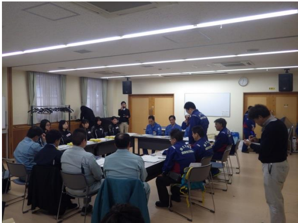
徒歩パト事前説明(鶴見市場 コミュニティハウス多目的室)