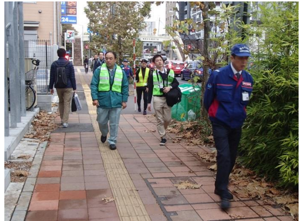
徒歩パト(市場入口交差点～ 生麦一丁目交差点・上り線)その2