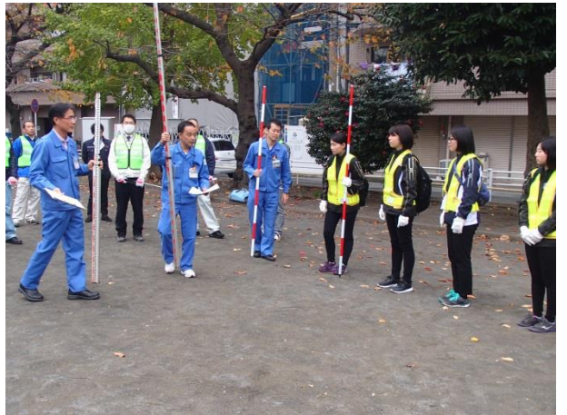
鶴見中継所テント設置箇所点検 (市場公園)