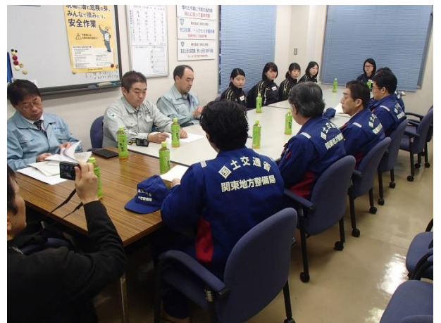
意見交換会(神奈川出張所)