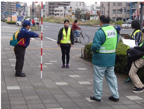
徒歩パト(異状発見状況)