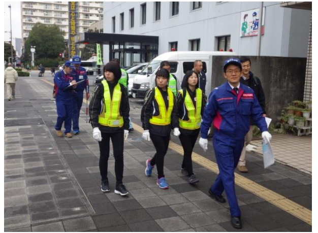
徒歩パト(市場入口交差点～ 生麦一丁目交差点・下り線)その2