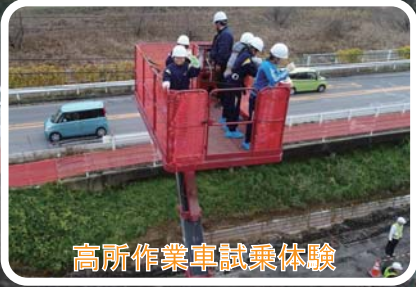
高所作業車試乗体験

H30牛久土浦BP地盤改良工事では、稲敷市立高田小学校5年生の生徒の皆さんをお迎えし、現場見学会を開催しました。子供達には、工事の事業及び内容説明や重機等の試乗体験、ものづくり体験をしてもらい、建設工事の仕事に触れ関心を抱いてもらうことで、未来を担う子供達に建設工事の魅力を発信しました。