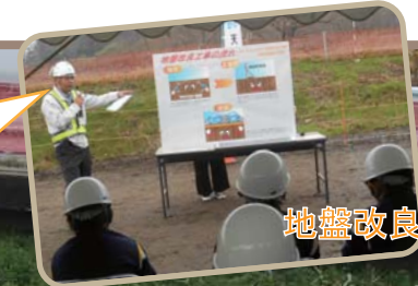
地盤改良工事の説明

(監理技術者より) この見学会に参加した子供達が大人になった時、建設業関係の仕事に携わってくれることを期待しています。