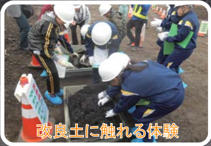
改良土に触れる体験

(監理技術者より) この見学会に参加した子供達が大人になった時、建設業関係の仕事に携わってくれることを期待しています。