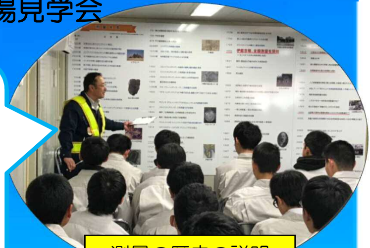
測量の歴史の説明