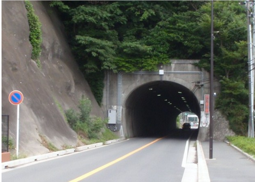
比与宇(ひよう)トンネル横浜側坑口