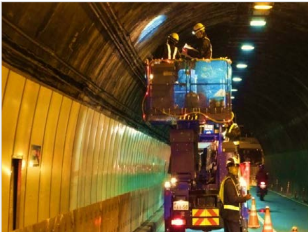
現地での体験イメージ写真