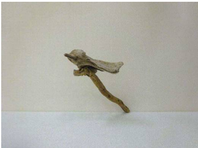
3 「木にとまった鳥」 河合 伽粹