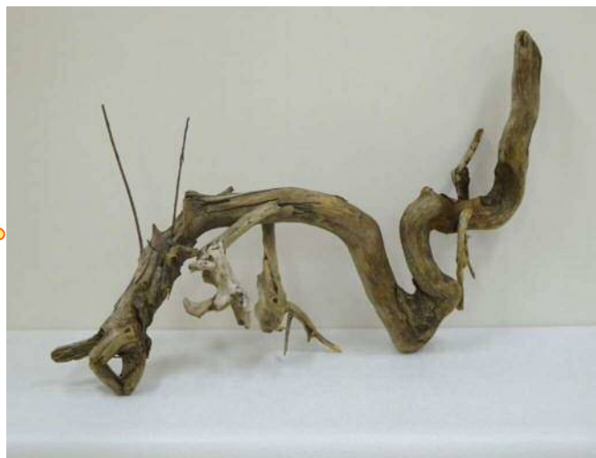
14 「龍」 河合 織叶