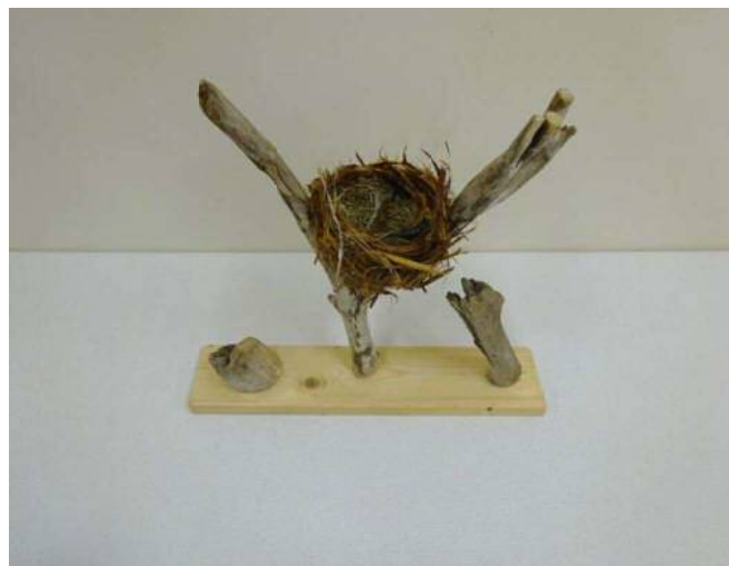
13 「おながのす」 石飛 柚