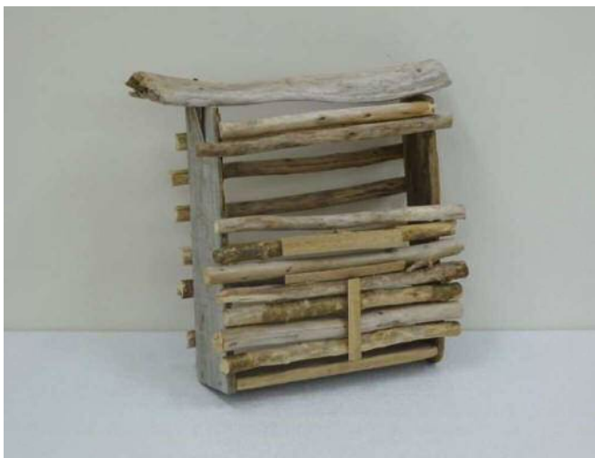
12 「森のポスト」 宝利 百華