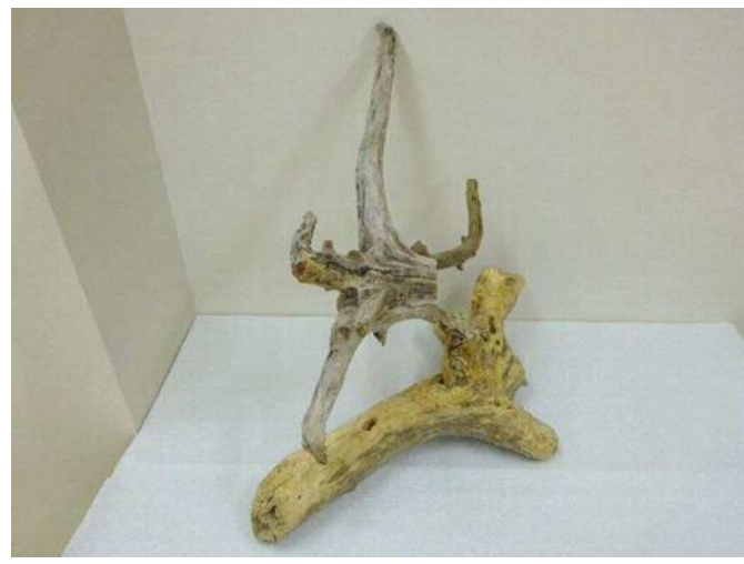
15 「つるのひらい」 坂大 穂典