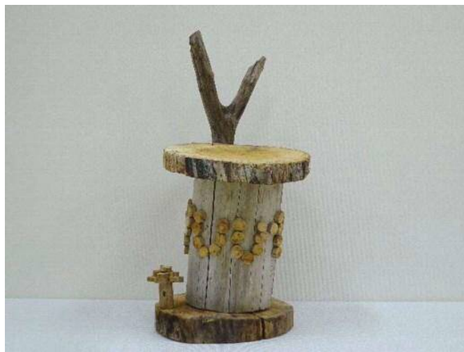
21 「アイディアイス」 林 悠斗