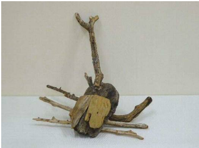
18 「流木カブトムシ」 宝利 一誠