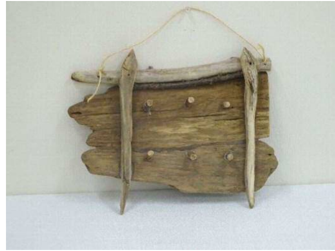
17 「キーフック」 林 拓史