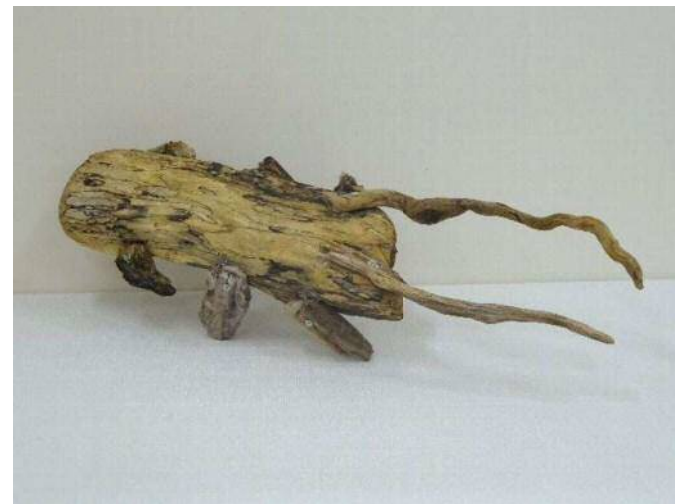
4 「大きなクワガタ」 大川 向陽