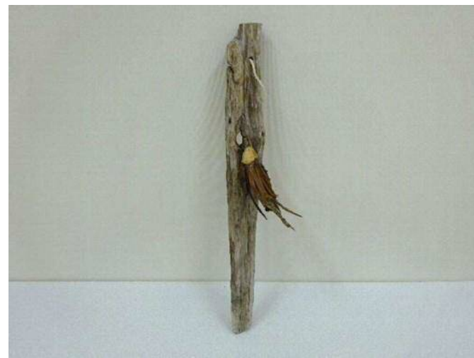
6 「キツツキ」 山田 桜娘