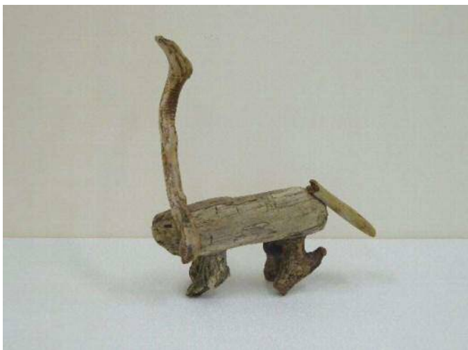
7 「なぞのネッシー？」 林 快星