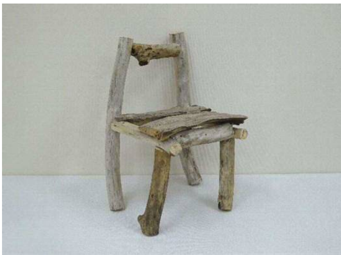
20 「流木で作ったいす」 大竹 璃夢