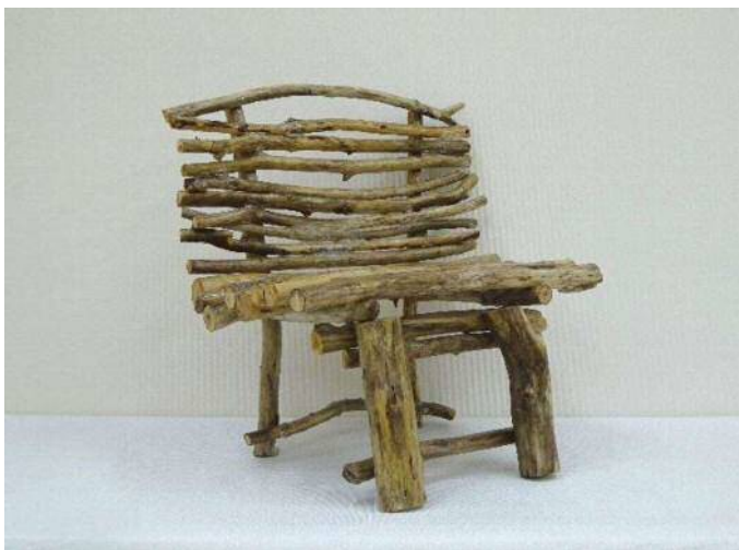
22 「木のいす」 林 佑哉