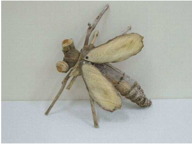
16 「ハチ」 杉木 悠吏