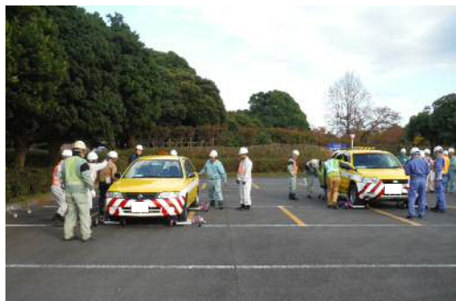
車両移動用ジャッキによる放置車両の車両移動訓練状況