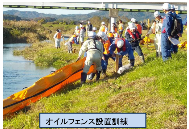
オイルフェンス設置訓練