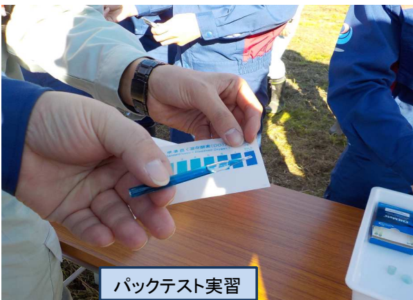
パックテスト実習