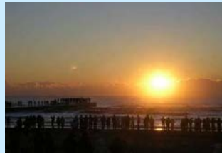
初日の出遥拝スポット