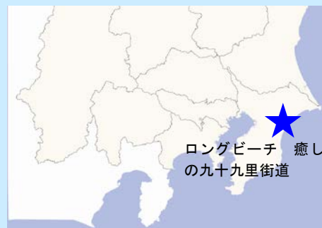
ロングビーチ 癒しの九十九里街道