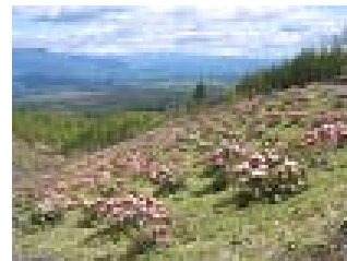
上信越高原国立公園