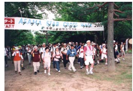
アサマスタークロスウォーク