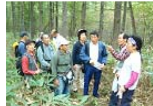
ネイチャーガイドプログラム