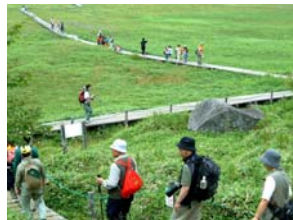
トレッキングプログラム