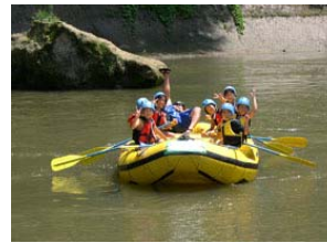
アウトドア体験プログラム