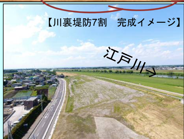
川裏7割完成(H30.3) 春日部市西宝珠花地区