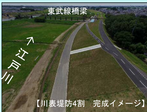
川表4割完成(H30.4) 春日部市西金野井地区