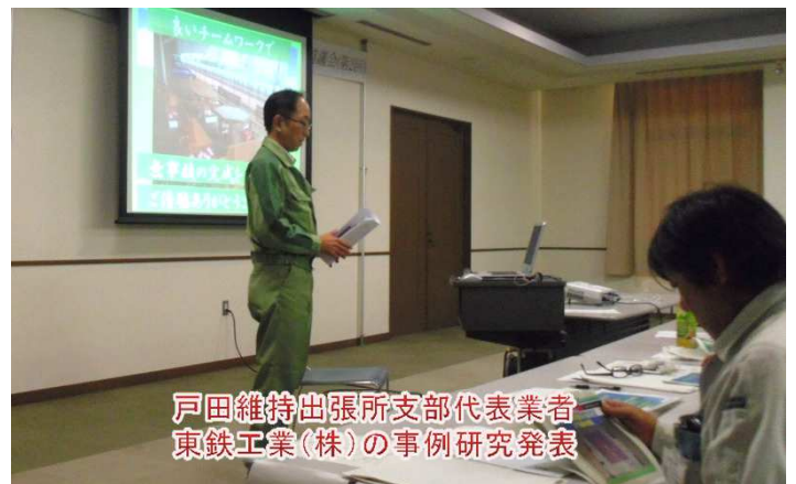
戸田維持出張所支部代表業者 東鉄工業(株)の事例研究発表