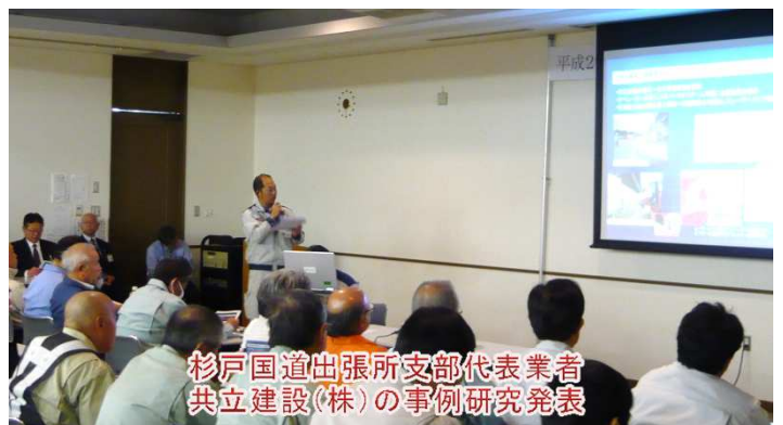
杉戸国道出張所支部代表業者 共立建設(株)の事例研究発表