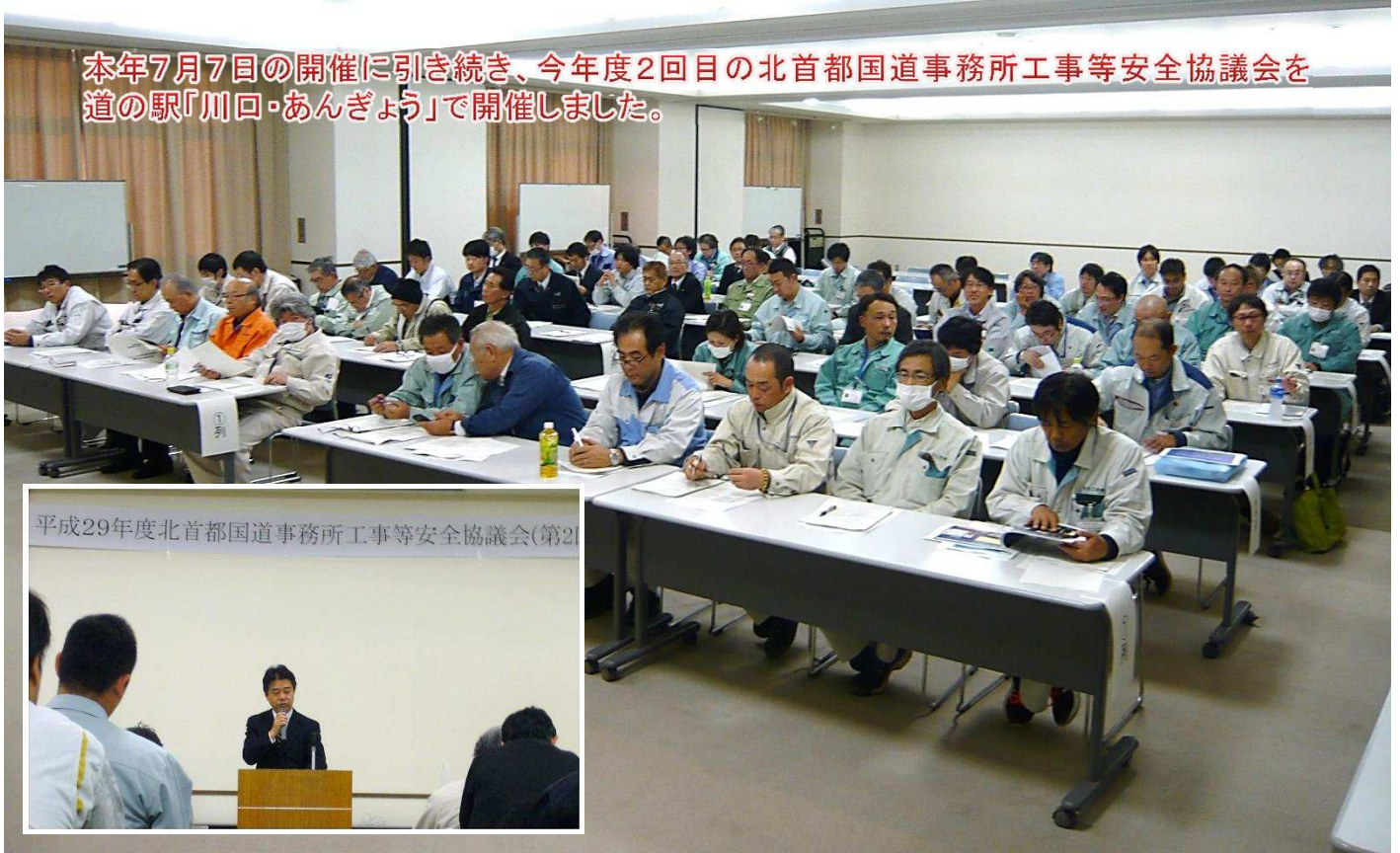
平成29年度北首都国道事務所工事等安全協議会(第2回)

本年7月7日の開催に引き続き、今年度2回目の北首都国道事務所工事等安全協議会を道の駅「川口・あんぎょう」で開催しました。