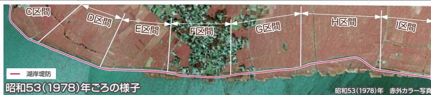
G～I区間では、湖岸堤防から20～80m近く沖合まで湖岸植生帯が広がっていました。