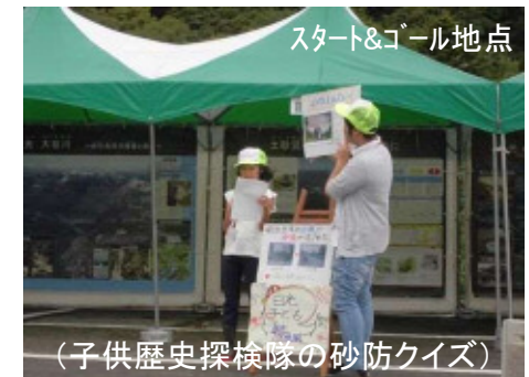
スタート&ゴール地点 (子供歴史探検隊の砂防クイズ)