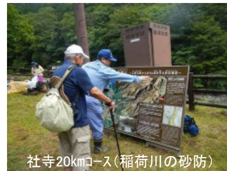
社寺20kmコース(稲荷川の砂防)