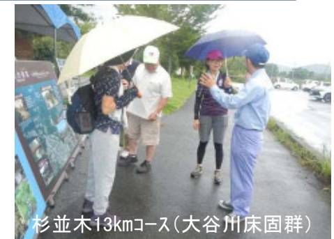
杉並木13kmコース(大谷川床固群)