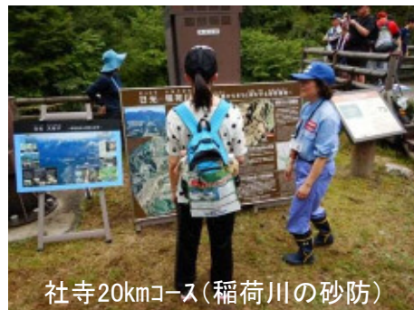
社寺20kmコース(稲荷川の砂防)