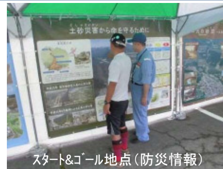
スタート&ゴール地点(防災情報)