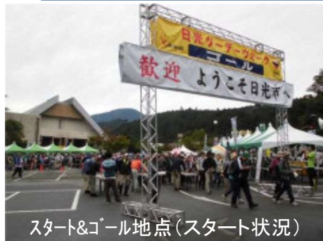
スタート&ゴール地点(スタート状況)