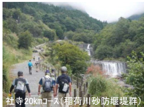
社寺20kmコース(稲荷川砂防堰堤群)