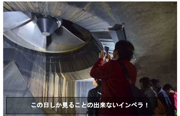
この日しか見る事の出来ないインペラ！