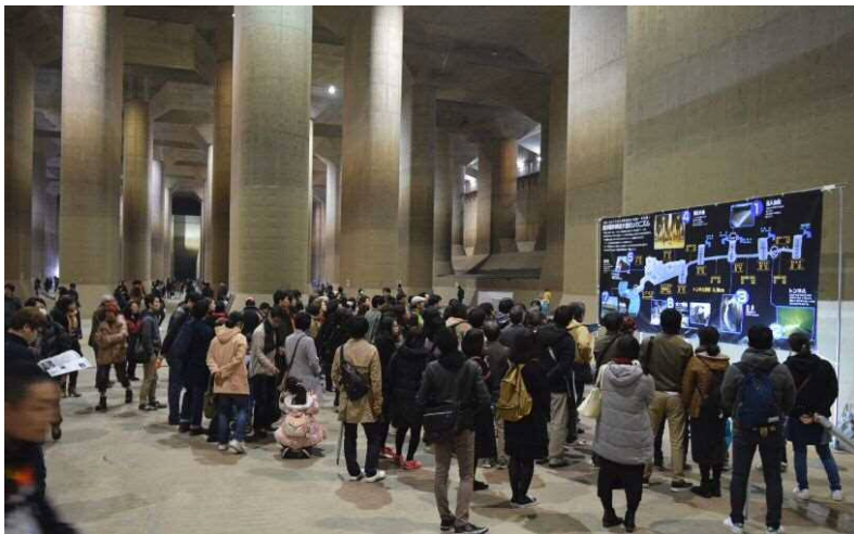
昨年の特別見学会の見学風景(平成29年11月18日)

(お申込み方法及び詳細はHPをご確認下さい。http://www.ktr.mlit.go.jp/edogawa/edogawa00733.html)