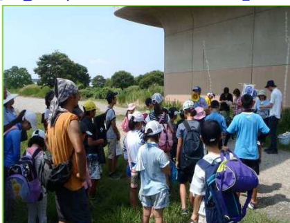
水質浄化の仕組みについて説明

8月4日（土）松戸市古ヶ崎地先において、松戸市生涯学習推進課主催のカヌー教室が開催されました。また、それに併せて古ヶ崎浄化施設の見学を行いました。水質浄化の仕組みについて学ぶ江戸川探検となりました。