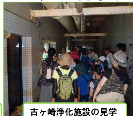
古ヶ崎浄化施設の見学