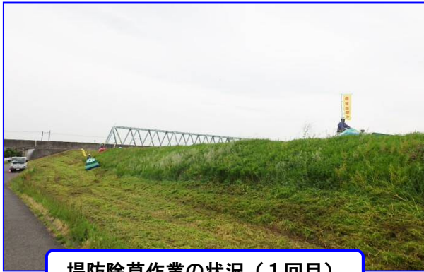
堤防除草作業の状況(1回目)

松戸出張所管内の江戸川と坂川において、8月17日(金)から2回目の堤防除草を行っています。除草後(9月上旬)の台風シーズンの前には堤防に亀裂など異常がないか徒歩により堤防点検を行います。