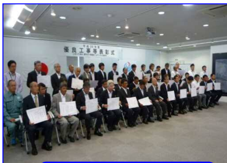
江戸川河川事務所での 表彰式後の記念撮影

7月17日（火）に江戸川河川事務所で開催された表彰式で、平成29年度に完成した工事などの中から特に優れた成績を収めた工事、技術者について表彰式が行われました。松戸出張所管内の工事では4件の工事が表彰されました。