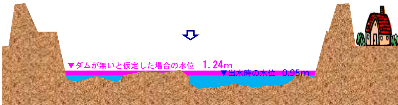
図2 宮ヶ瀬ダムにより想定される水位の低減（才戸橋地点）

※「ダムが無いと仮定した場合の水位」は、当該時刻のダム地点の貯留量をダム下流の中津川才戸橋地点の水位低減量に換算しています。