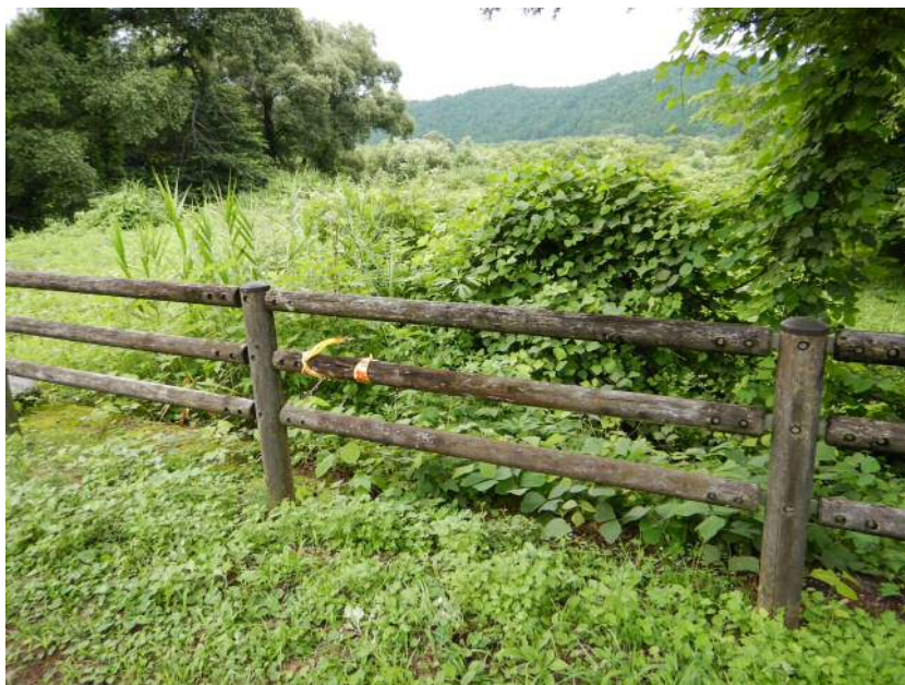
※応急措置として、立入禁止テープにて注意喚起