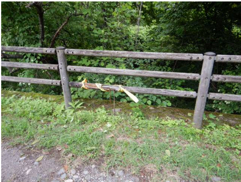
※応急措置として、立入禁止テープにて注意喚起