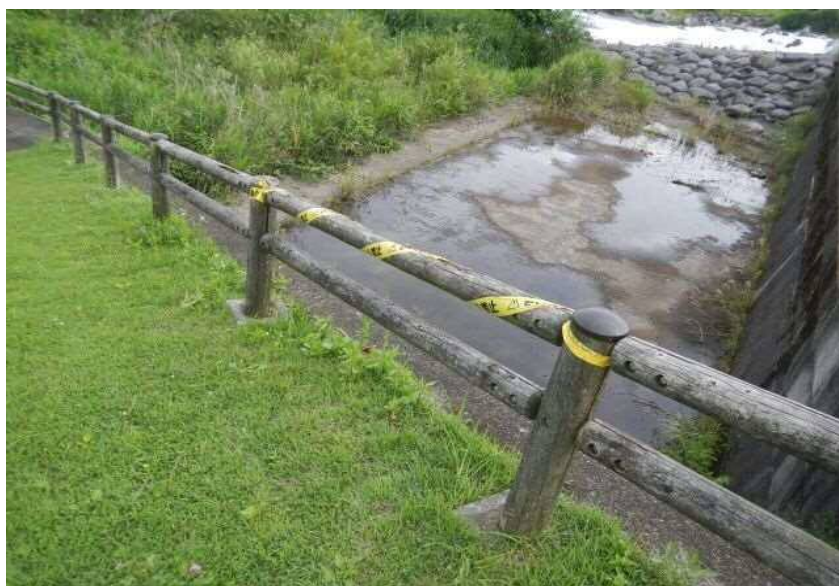
※応急措置として、立入禁止テープにて注意喚起