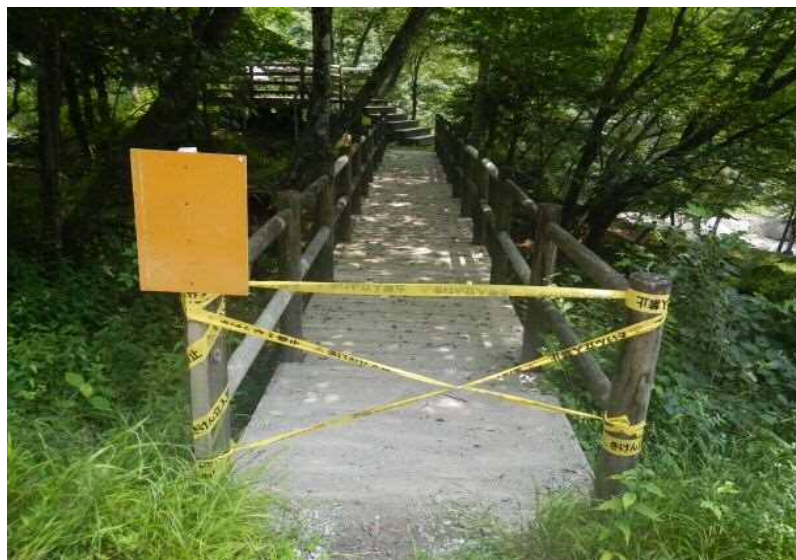
※応急措置として、立入禁止テープにて展望台入口を封鎖