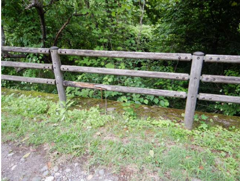
※転落防止柵老朽化