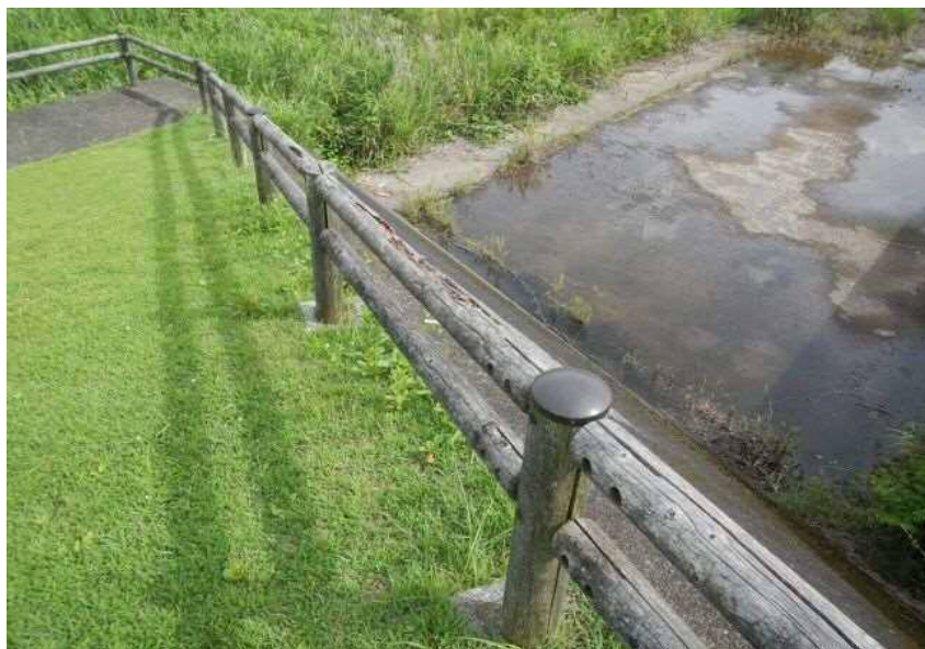
※転落防止柵老朽化