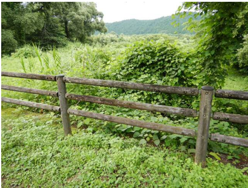
※転落防止柵老朽化