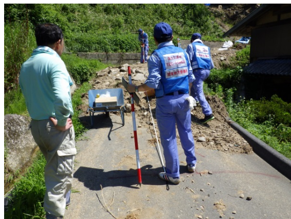
【道路班】広島県東広島市での被災状況調査