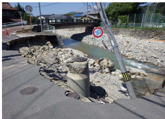
【河川班】広島市隠畑川での被災状況調査