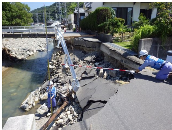
【河川班】広島市隠畑川での被災状況調査