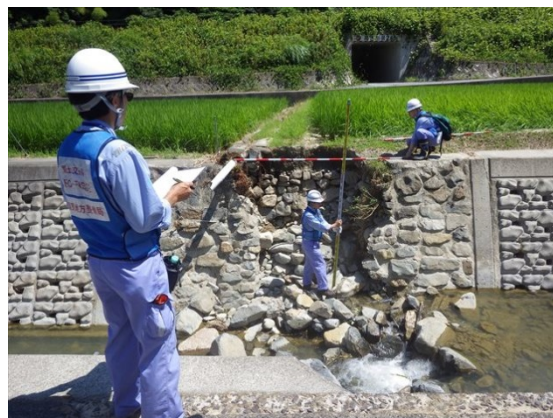
【河川班】広島市隠畑川での被災状況調査