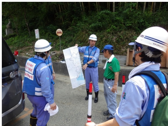
【河川班】岡山県総社市での被災状況調査

■7/15(日) 関東地方整備局 TEC—FORCE 【河川班】活動状況 活動箇所:中国地方整備局管内(岡山県総社市、広島県広島市等)