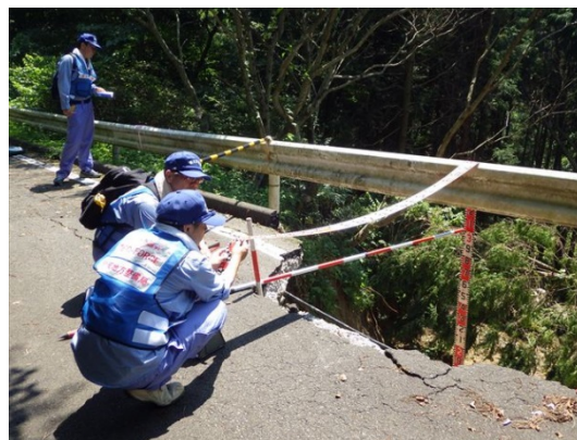
【道路班】岡山県井原市での被災状況調査