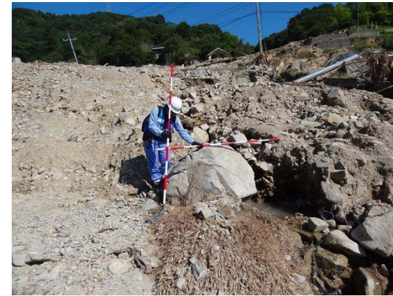
【砂防班】広島県呉市安浦町での被害状況調査