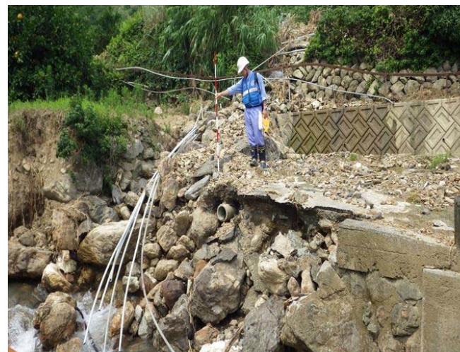
【河川班】愛媛県宇和島市吉田地区被災状況調査