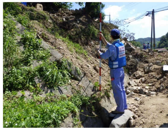
【道路班】広島県東広島市での被災状況調査