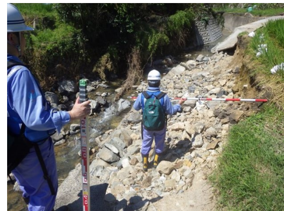
【河川班】広島市隠畑川での被災状況調査