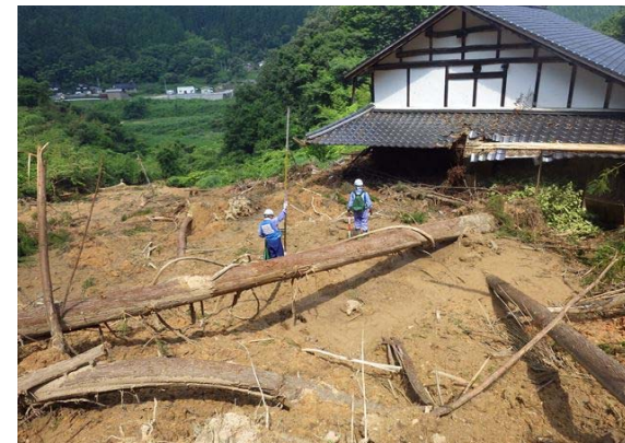
【砂防班】岡山県新見市での被害状況調査