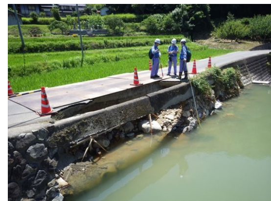
【河川班】広島市隠畑川での被災状況調査