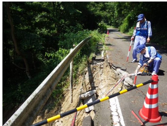
【道路班】岡山県井原市での被災状況調査

■7/15(日) 関東地方整備局 TEC—FORCE 【道路班】【砂防班】活動状況 活動箇所:中国地方整備局管内(岡山県井原市、広島県東広島市等)