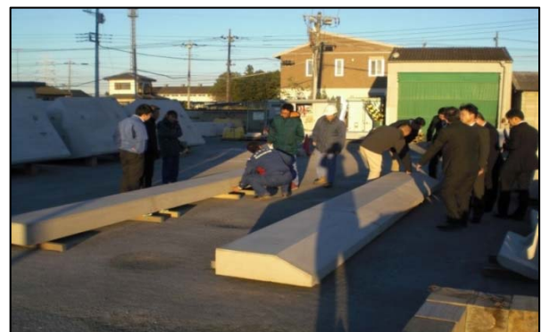
図-4 試作ブロックを見ながら協議

協会に確認したところ、本製品は試作段階で製品化の予定は無いとの事であったが、これを改良する事で鬼怒川緊急対策プロジェクトに適用できると考え、試作品の実物を見ながら細部形状について事務所と協会とで協議する事となった。（図-4）