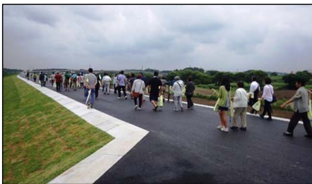
図-6 堤防用法肩ブロック 施工後写真