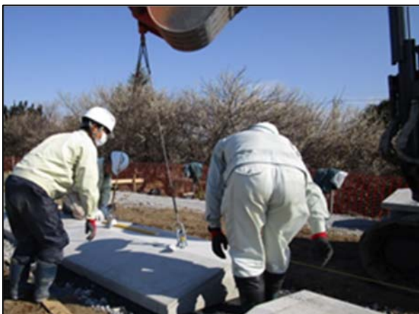
図-8 ブロック据付状況(吊り上げ)