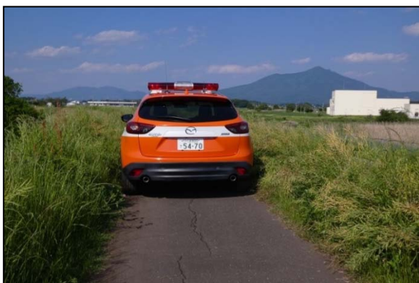
図-3 堤防天端の法肩における雑草繁茂状況