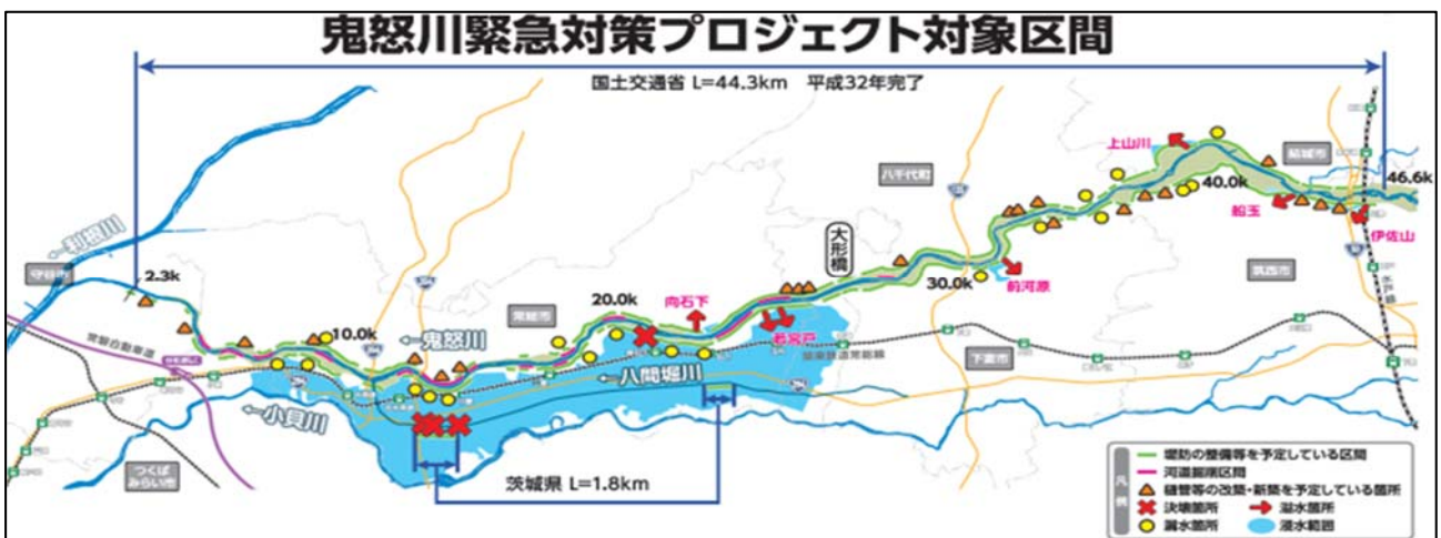
図-1 鬼怒川緊急対策プロジェクト 対象区間

また、プロジェクト推進の過程で一歩進んだ取り組みや工夫を講じることで、付加価値を生み出す取り組みとして「鬼怒川緊急対策プロジェクト+1（プラスワン）」を実施しており、その第1弾としてかわまちづくり支援制度を活用して街と川の拠点を繋ぎ、サイクリングロードやリバースポットを整備していくため、堤防天端の利便性や維持管理性の向上に考慮する必要があった。