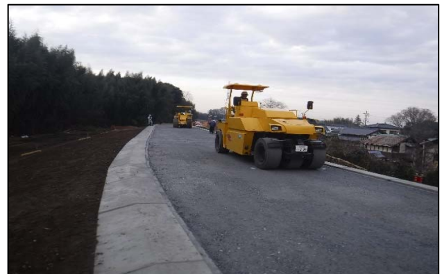
図-7 試験施工状況（路盤工）

天端舗装工の施工手順として、従来は「路盤工→舗装止めブロック→舗装→法肩盛土」の4工程が必要であったが、開発した堤防用法肩ブロックを使用した結果「堤防用法肩ブロック設置→路盤工→舗装工」の3工程に軽減され、工程短縮に繋がる事が確認できた。（図-7）