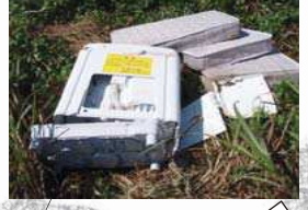
●洗濯機・マットレス