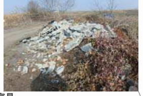
●コンクリートブロック殻