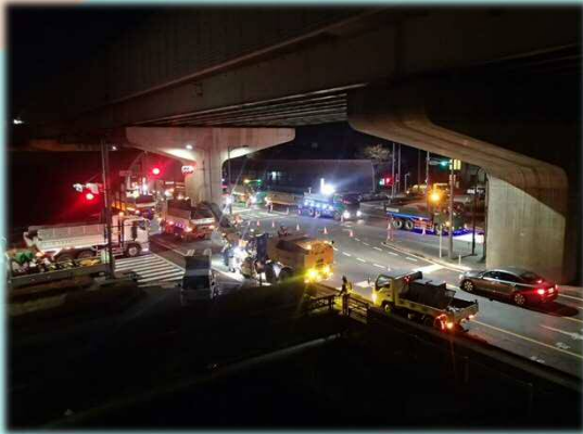
交差点部 切削オーバーレイ