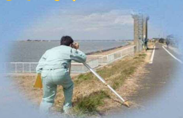
河川管理資料に必要な現地調査

弊社では時代のニーズに添い、スピード感を持って仕事出来るよう若手技術者の教育に力を入れております！