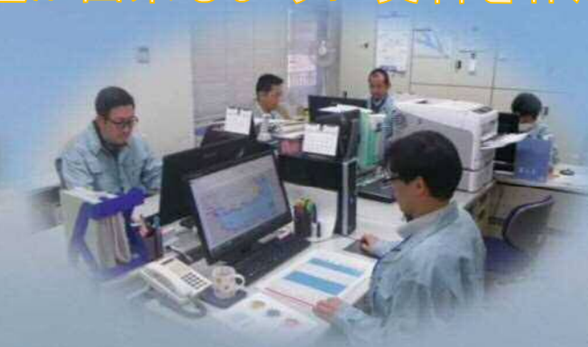
工事図面の作成・修正