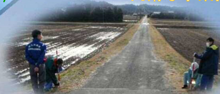
工事発注計画の為の現地確認