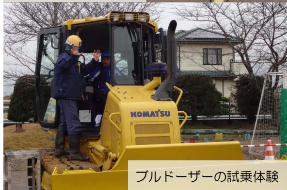
ブルドーザーの試乗体験