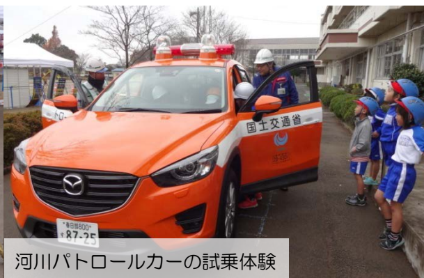
河川パトロールカーの試乗体験