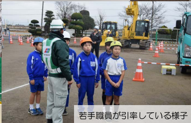
若手職員が引率している様子