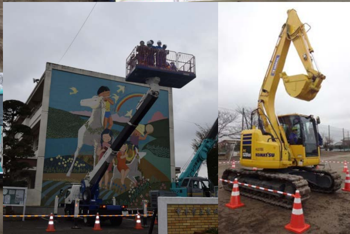
高所作業車やバックホウの試乗体験