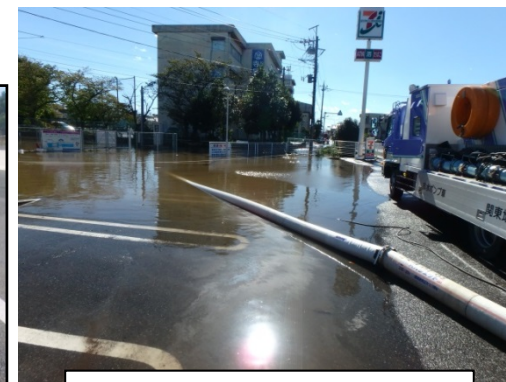
排水ポンプ車による排水状況 (埼玉県ふじみ野市)