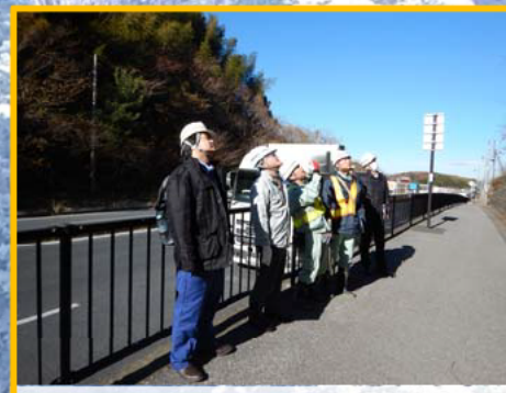
道路管理者や有識者と国道の安全性を評価しています

■仕事のやりがい 道路のお医者さんとして、安全性を適切に評価し、異変にいち早く察知します。災害を未然に防ぐことで、道路のネットワークを維持・確保することが仕事のやりがいとなっています。