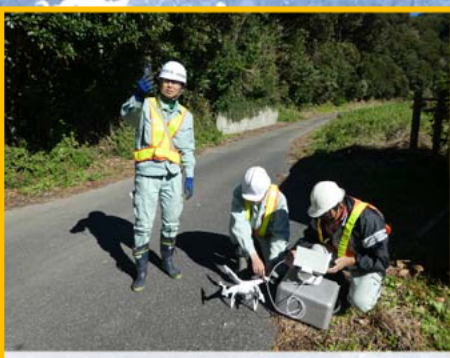
UAVを用いて広域の地形状況を調査しています