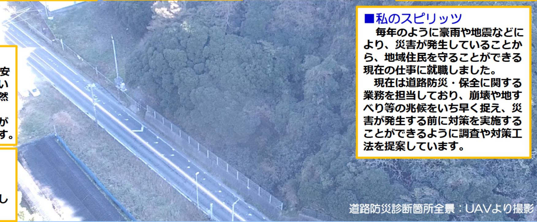
道路防災診断箇所全景：UAVより撮影

■私のスピリッツ 毎年のように豪雨や地震などにより、災害が発生していることから、地域住民を守ることができる現在の仕事に就職しました。 現在は道路防災・保全に関する業務を担当しており、崩壊や地すべり等の兆候をいち早く捉え、災害が発生する前に対策を実施することができるよう調査や対策工法を提案しています。