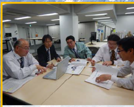
関係者で資料の内容を協議・精査しています