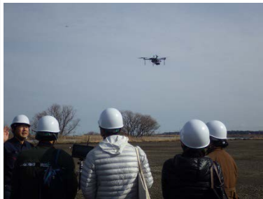
UAV・3Dスキャナの説明