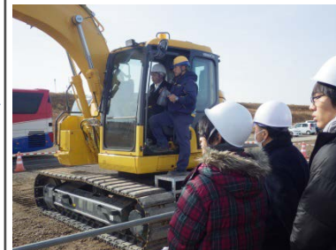
MCバックホウの体験試乗