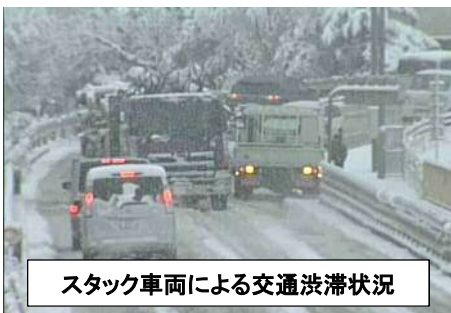
スタック車両による交通渋滞状況

例年、急勾配、カーブ箇所等において立ち往生する車両が見受けられます。立ち往生が原因で「通行止め」になるおそれもありますので、滑り止め対策を確実に実施されるようお願いいたします。