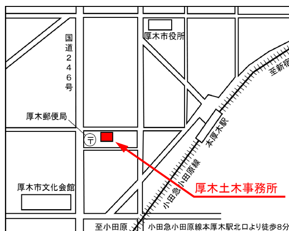
厚木土木事務所（厚木南合同庁舎）案内図