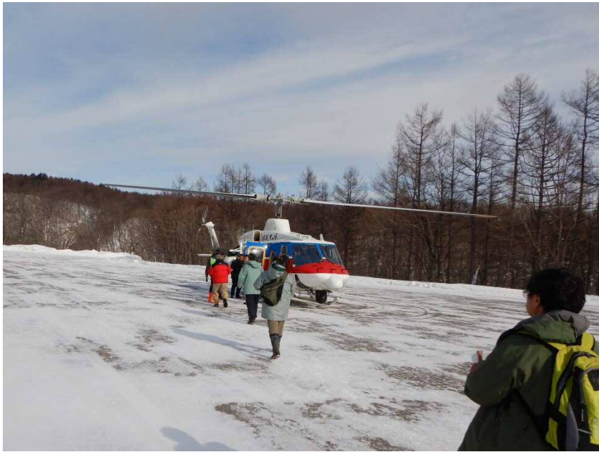
国土交通省防災ヘリコプター(あおぞら号)

防災ヘリに関係機関の職員と関東地方整備局の職員が搭乗し、上空から現地状況を確認しました。