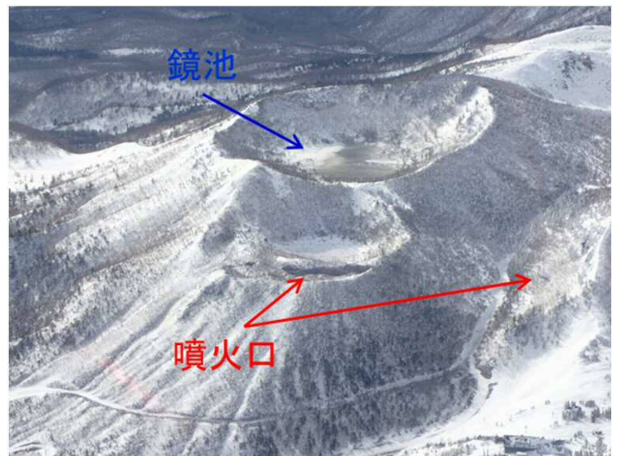
鏡池北側の噴火口周辺の状況