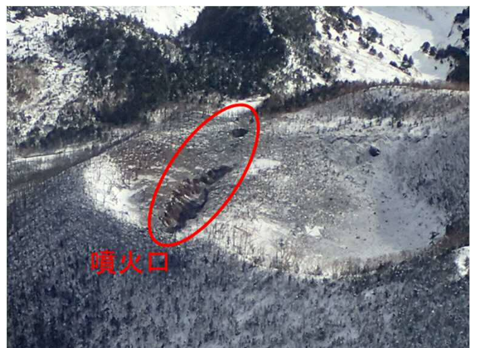
鏡池北側の噴火口周辺の状況