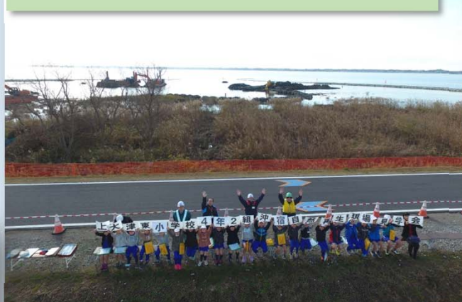
自然再生現場を背景にドローンで記念撮影!!