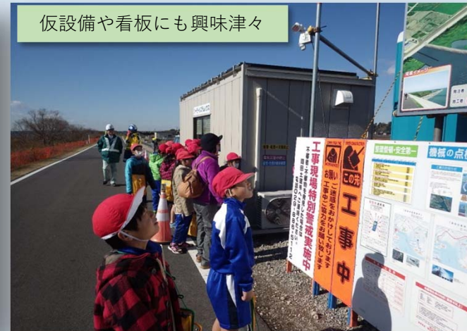
仮設備や看板にも興味津々