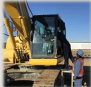
女子でも乗りこなせます