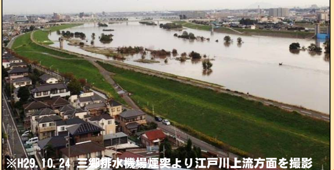
※H29.10.24 三郷排水機場煙突より江戸川上流方面を撮影

※三郷排水機場では、2つの台風で降り注いだ雨により水位上昇した綾瀬川並びに中川の洪水を、八潮排水機場と連携して、5台ある排水ポンプ(25mプールを2秒で排水する能力)を順次稼働させながら、江戸川への排水作業を実施しました。江戸川の水位は一時的に堤内側の住宅地よりも高くなりましたが、広い川幅と高い堤防で流域の洪水を安全に海へと運んでくれているのがわかります。